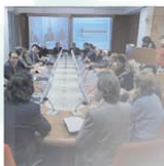
● MANAGERIALITA': IMPRESA E COMUNICAZIONI