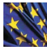
● QUADRO NORMATIVO COMUNITARIO DELLE TELECOMUNICAZIONI