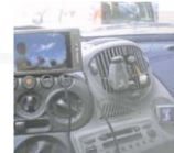
● RADIO E TV IN MOBILITA'