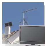
● TV DIGITALE

● Obiettivo del corso è fornire, attraverso lo sviluppo di specifici progetti, una visione integrata dei processi relativi a: