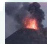
● COMUNICARE LE EMERGENZE