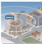
● WI MAX: EVOLUZIONE DEL MERCATO ITALIANO