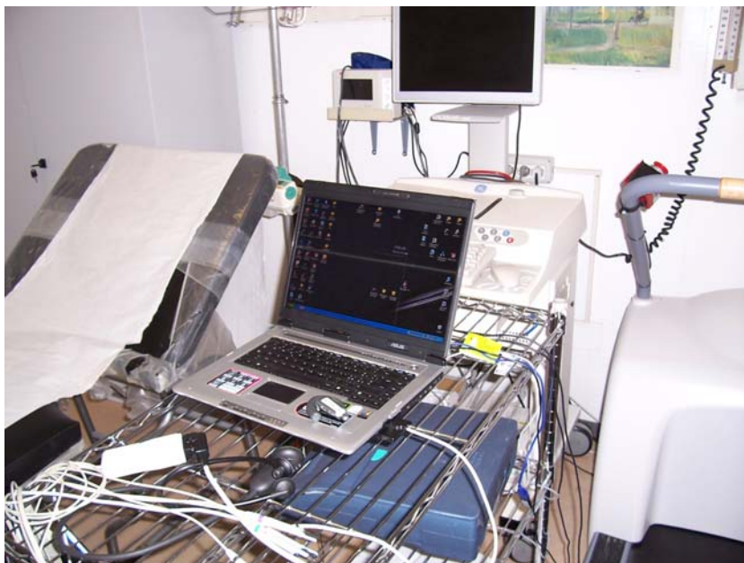
Fig. 2 – Postazione server.