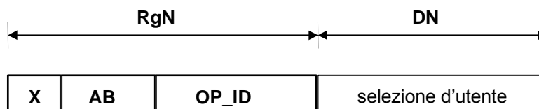
Figura 7.1 - Formato del numero RgN scambiato tra reti fisse

Il formato del numero RgN scambiato tra le reti fisse è indicato in Figura 7.1.